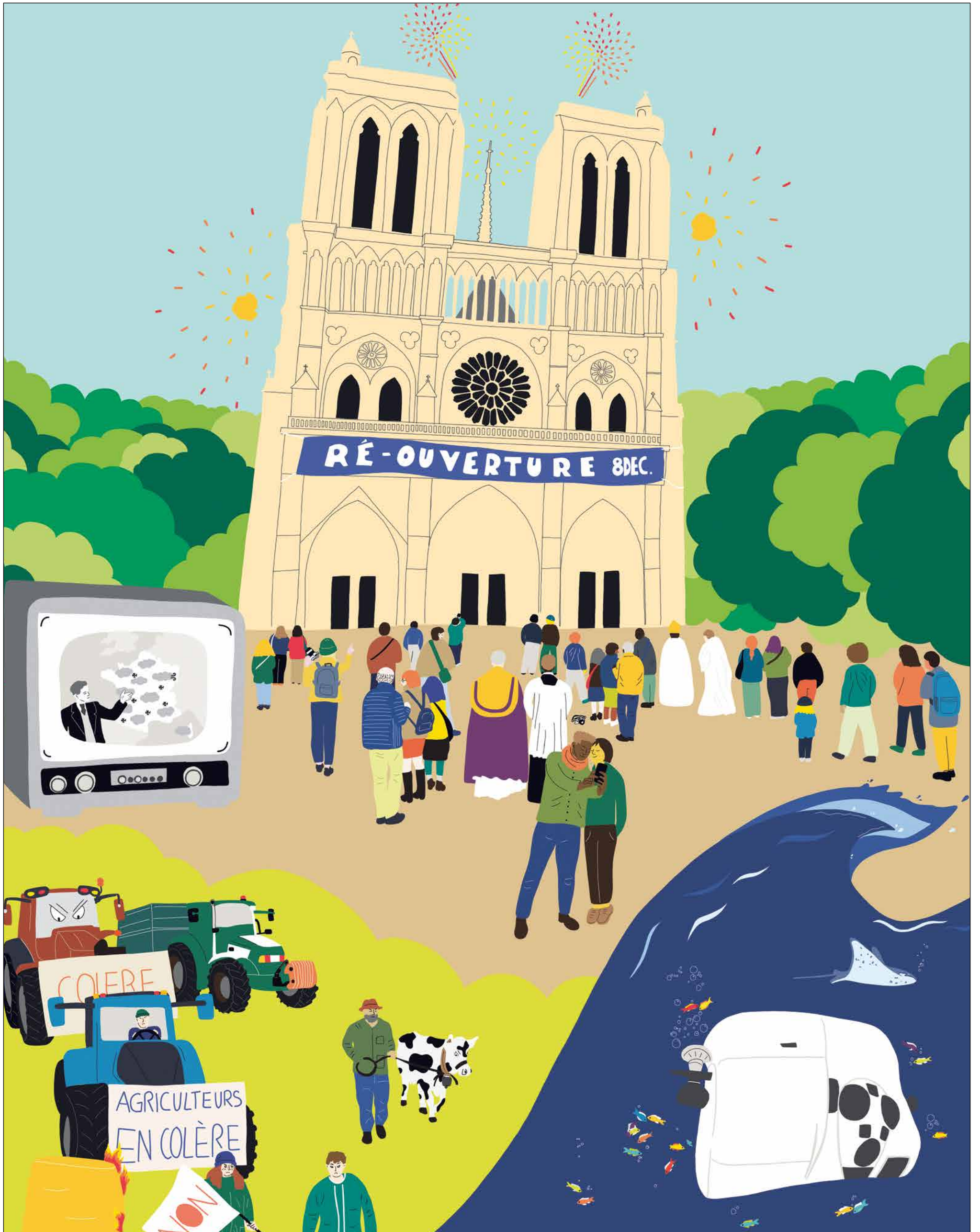
Illustration : Charlotte Pargue